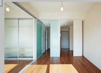
ご案内のお部屋は反転タイプとなります。