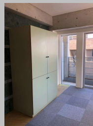
居室内床：タールカーペット