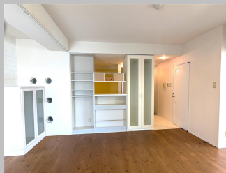
同タイプのお部屋です。ミニキャビネットはありません。