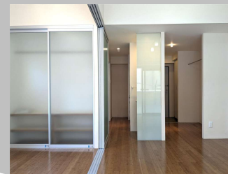
同タイプのお部屋です