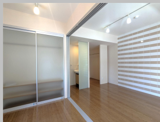
同タイプのお部屋です